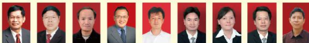
欧阳晓平 周益春 黄建宇 周光文 孙立忠 王金斌 钟向丽 林建国 尹付成 中国工程院院士 国家杰青 国家级特聘教授 国家级特聘教授 教育部跨世纪人才 教育部跨世纪人才 全国百篇优博